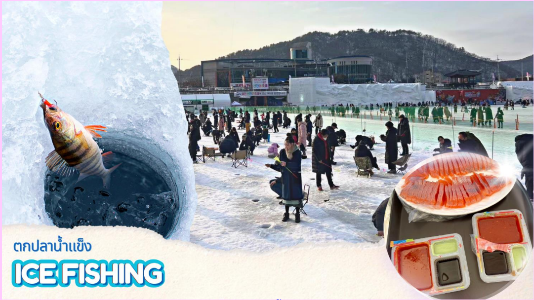
ตกปลาน้ำแข็ง ICE FISHING

(**รวมอุปกรณ์ตกปลาแบบเบสิค**) วิธีการตกปลา คือ หย่อนเหยื่อปลอม (ที่ทางเทศกาลเตรียมไว้ให้) ลงไปในรู จากนั้นก็กระตุกไม้เบ็ดตกปลาเบาๆ ให้เหมือนเหยื่อกำลังลอยไปลอยมาในน้ำ และปลาก็จะเข้ามากินเหยื่อ ง่ายๆเพียงแค่นี้ก็ทำให้ท่านตกปลาได้อย่างสนุกสนาน )