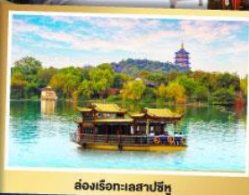
ล่องเรือทะเลสาบฉีหู