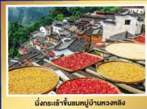
นักรบเข้าชั้นหมู่บ้านหวงหลิง