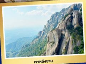
เขาหิงชาน