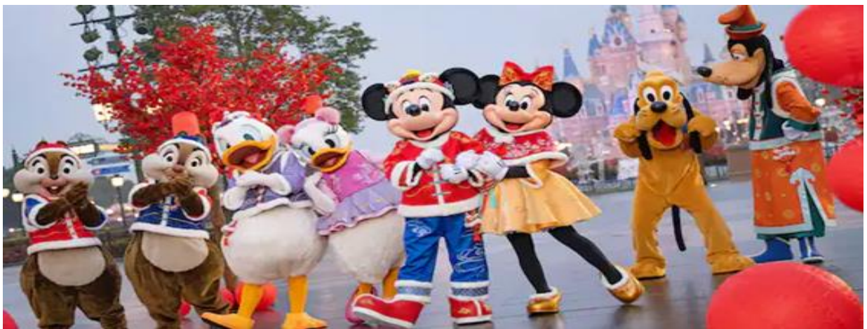
GO1PVG-FM002 เซียงไฮ้ ดิสनीแลนด์ ขึ้นชมวิวหอดไป๋มู่ก 5วัน 4คืน โดยสายการบิน Shanghai Airlines (FM)

สนุกกับเมืองเทพนิยาย เป็นโซนที่ตั้งของปราสาทดิสนีย์ ที่มีชื่อว่า “Enchanted Storybook Castle” ท่านจะได้พบกับโชว์อันยิ่งใหญ่ตระการตาและตัวการ์ตูนที่ท่านชื่นชอบ อาทิเช่น สโนว์ไวท์, เจ้าหญิง นิทรา, ซินเดอเรลล่า, มิกกี้เมาท์, หนีมัลลู และเพื่อนๆตัวการ์ตูนอันเป็นที่ใฝ่ฝันของทุกคน และยังมีโซน กิจกรรมอย่างเช่น “Once Upon a Time Adventure” เป็นการผจญภัยภายในปราสาทดิสนีย์ พบ เรื่องราวของสโนว์ไวท์ ผ่านจอภาพแบบสามมิติ หรือ “Alice in Wonderland Maze” เป็นทางเดินผ่าน เขาวงกตเพื่อเข้าไปเจอตัวละครจาก Alice in Wonderland และเครื่องเล่นไฮไลท์ของโซนนี้ก็คือ “Seven Dwarfs Mine Train” นั่งรถไฟเข้าเหมืองแร่ไปกับคนแคระทั้ง 7 ชวนให้สนุกและหวาดเสียว