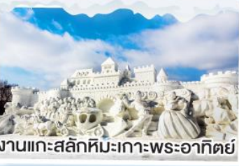
งานแกะสลักหิมะเกาะพระอาทิตย์