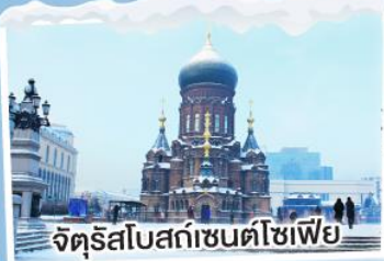
จัตุรัสโบสถ์เซ็นต์โซเฟีย