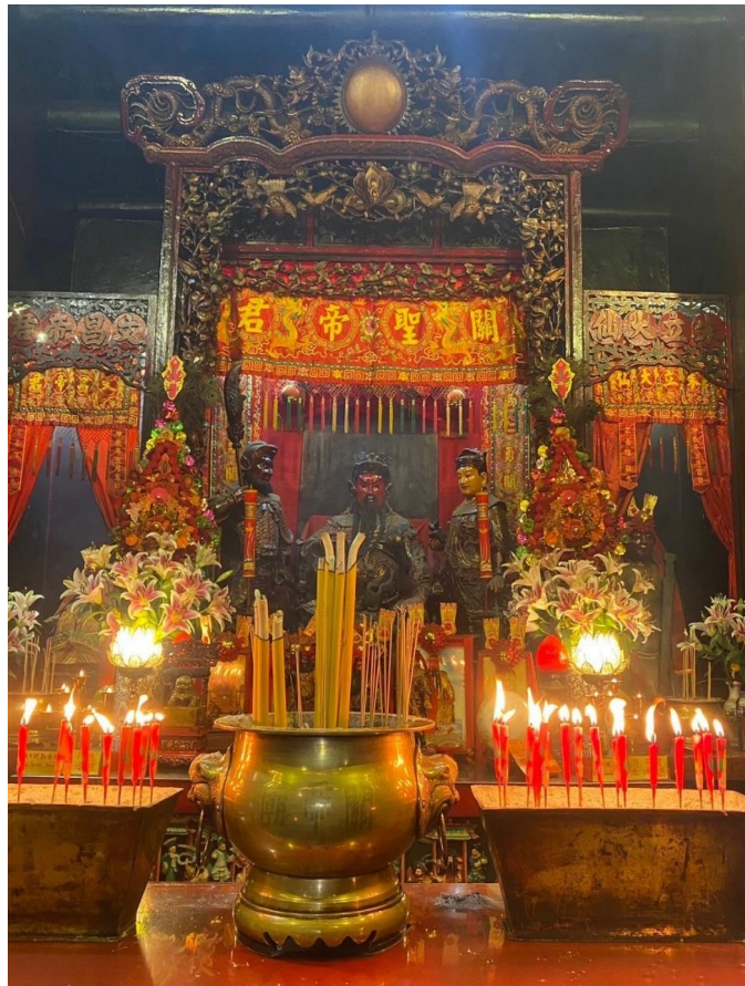
หน้าที่ 9 | ภาพประกอบใช้เพื่อการโฆษณาเท่านั้น

จากนั้นนำท่านไปสักการะ เจ้าพ่อกวนอู วัดกวนไท หรือที่คนไทยนิยมเรียกว่า วัดเทพเจ้ากวนอู เป็นสถานที่ศักดิ์สิทธิ์อันเลื่องชื่อ ถือว่าเป็นวัดแห่งเดียวในเขตเกาลูน ที่สร้างขึ้นเพื่อบูชาเทพเจ้ากวนอู ซึ่งท่านเป็นเทพเจ้าแห่งความซื่อสัตย์ เปี่ยมไปด้วยคุณธรรม โดยศาลเจ้าพ่อกวนอูแห่งนี้ ผู้ที่มาไหว้สักการะ จะนิยม ขอพรเรื่องธุรกิจและบิรวาร เนื่องจาก “เจ้าพ่อกวนอู” เป็นเทพเจ้าที่รักษาคำพูดด้วยชีวิต รักคุณธรรม ซื่อสัตย์ ช่วยปกป้องสิ่งเลวร้าย อันตรายต่าง ๆ และ ช่วยเสริมอำนาจบารมีในการปกครอง ท่านมีจิตใจมั่นคงตั้งขุนเขา มีสติปัญญาเป็นเลิศ และไม่ประมาท ท่านจึงเป็นสัญลักษณ์แห่งความเข้มแข็ง โดดเดี่ยว ไม่ครั้นคร้ามต่อศัตรู ฉะนั้นการมาบูชาขอพรท่าน จะช่วยเสริมดวงไม่ให้เพลิงพลา้แก่ศัตรู ทำให้มีมิตรที่ซื่อสัตย์ และคุ้มครองบิรวารให้ก้าวหน้าและอยู่เย็นเป็นสุข ซึ่งผู้ประกอบอาชีพ ตำรวจ ทหาร และ นักการเมือง จึงมักจะนิยมบูชาเทพเจ้ากวนอู เป็นพิเศษ โดยในวัดกวนไท นอกจากจะได้ไหว้ขอพร เจ้าพ่อกวนอู แล้ว ภายในวัดยังมีจุดสำคัญที่ควรสักการะอีก 2 จุดหลัก ๆ ได้แก่ พระโพธิสัตว์ กวนอิม ไหว้ขอพรให้มีคนรักคนเมตตา และสำหรับใครที่ชอบโดนเอารัดเอาเปรียบ โดนโกง ก็ให้มาสักการะ ท่านเป่าก หรือที่เรารู้จักกันในนาม เป่าบู้จิ้น