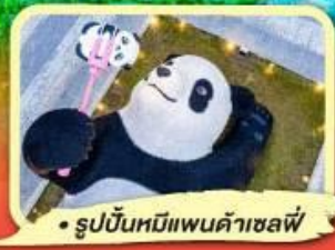
• รูปปั้นหมีแพนด้าเซลฟี่