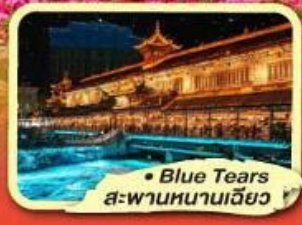
• Blue Tears สะพานหนานเฉียว

★ ไม่ลงร้านช้อปปิ้ง ★ พัก 4 ดาว ★ ชมโชว์ทิกเก็ต