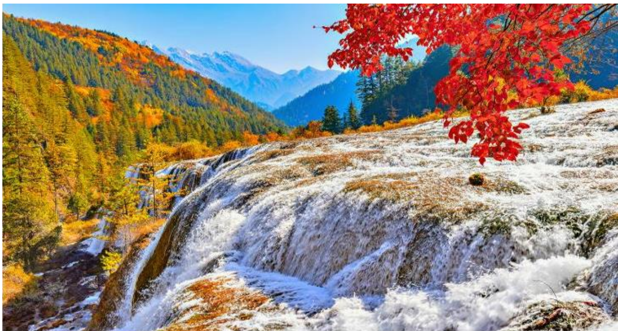
GO1TFU-CA001 เฉิงตู จี๋จ้ายโกว หวงหลง ภูเขาหิมะกลาเซียร์ต้ากู่ปิงชวาน ศูนย์หมีแพนด้า 7วัน6คืน โดยสายการบิน Air China (CA)

ทะเลสาบ5สี เป็นทะเลสาบที่มีสีของน้ำแปลกตา โดยเฉพาะเมื่อยามแสงอาทิตย์ตกกระทบพื้น สีของน้ำในทะเลสาบจะเปล่งประกายเปลี่ยนสีรุ้งดูงดงามมาก เป็นอุทยานที่เหมาะสมกับการไปถ่ายพรีเวดดิ้งธีมเทพนิยายมากๆ