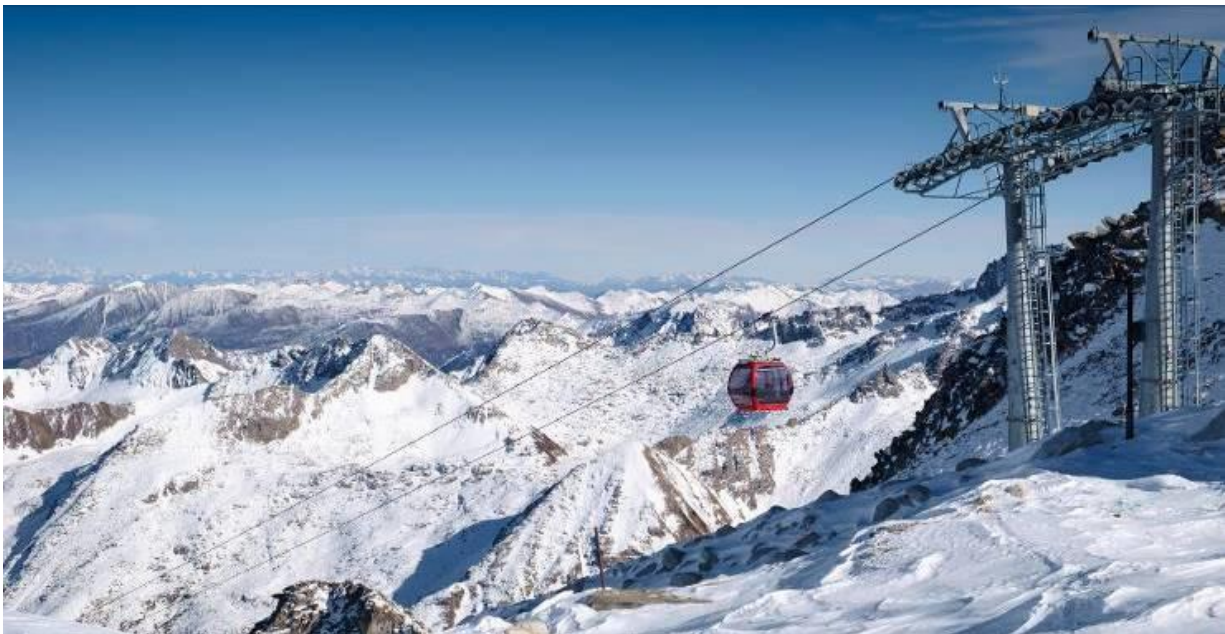
GO1TFU-CA001 เิงตุ จิวจ้ายโกว หวงหลง ภูผาหิมะกลาเซียร์ต้ากู่ปิงชว่น ศูนย์หมีแพนด้า 7วัน6คืน โดยสายการบิน Air China (CA)

เช้า รับประทานอาหารเช้า ณ ห้องอาหารภายในโรงแรม (มื้อที่ 10)