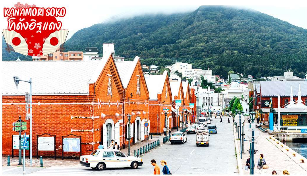
ชม โกดังอิฐแดง หรือ โกดังคานะโมริ (Kanamori Soko) สัญลักษณ์อีกแห่งหนึ่งของฮาโกดาเตะ โกดังเก็บสินค้าของเมือง แม้อาคารที่เห็นจะเป็นอาคารใหม่ที่ถูกรื้อสร้างขึ้นมาทดแทนอาคารหลังเก่า ซึ่ง ถูกไฟไหม้ครั้งใหญ่เผาทำลายไปเมื่อปี 1970 แต่ยังคงเอกลักษณ์และความโดดเด่นของสถาปัตยกรรม แบบดั้งเดิม