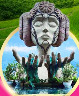
โมนาน่า ซาปา คาเฟ่