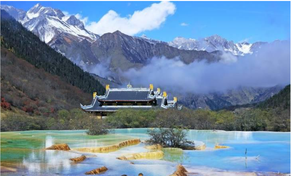
GO1TFU-MU007 เฉิงตู จี๋จ้ายโกว หวงหลง ดุหมี่แพนด้า สวนสวรรค์ดอกไม้สีฤดู 6วัน 5คืน โดยสายการบิน China Eastern (MU)