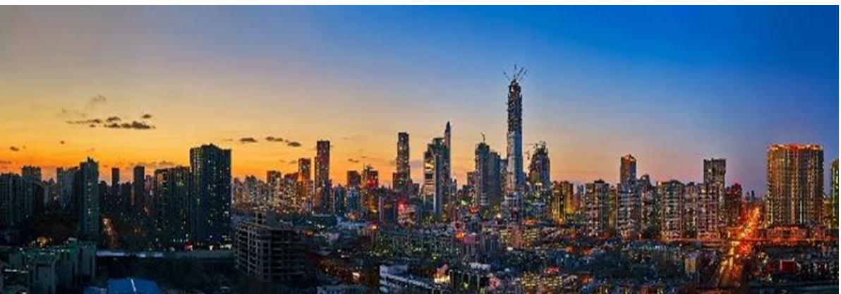
GO1PKX-MU001 ปักกิ่ง เชียงไฮ่ ล่องเรือเมืองโบราณอยู่เงิน(นั่งรถไฟความเร็วสูง) 6วัน 4คืน โดยสายการบิน China Eastern(MU)/Shanghai Airlines(FM)

วันที่สอง กรุงเทพฯ (MU2072: 00.40 – 06.35) – สนามบินปักกิ่งต้าชิง – จตุรัสเทียนอันเหมิน – พระราชวังต้องห้าม – พิพิธภัณฑ์ภาพยนตร์จีน – ย่านซานหลี่ถุน+ร้านPOP MART 00.40 น. ออกเดินทางสู่ กรุงปักกิ่ง โดยสายการบิน China Eastern เที่ยวบินที่ MU2072