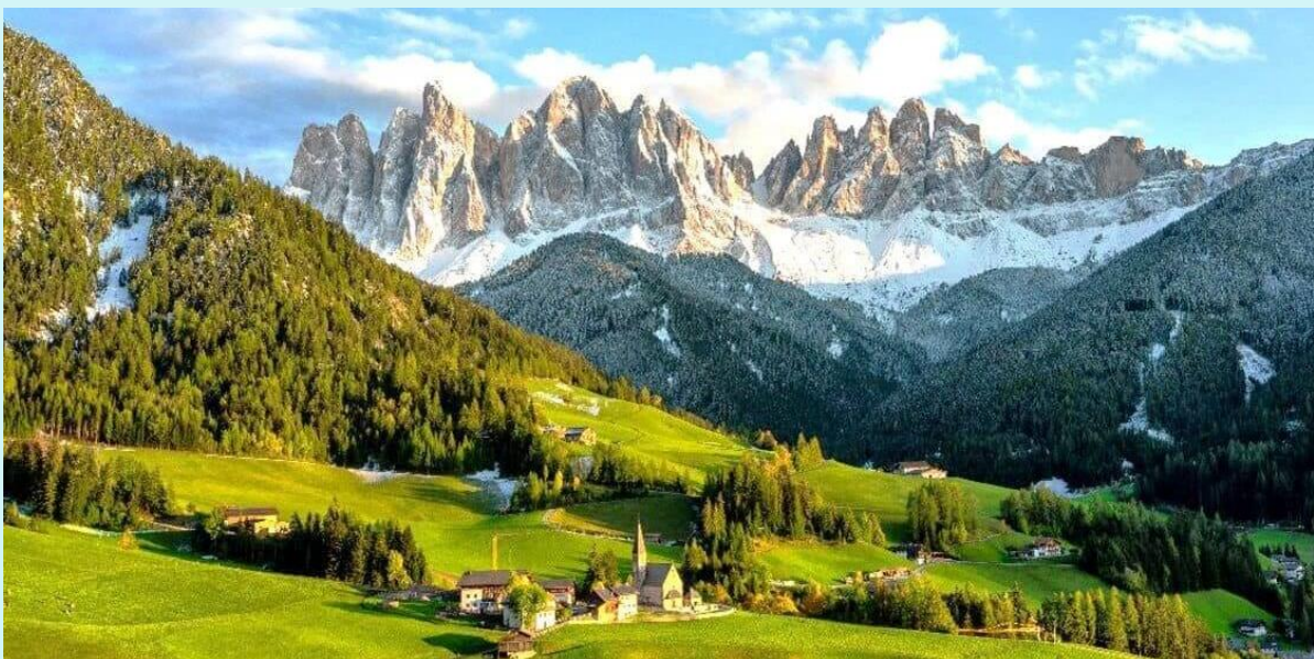
VFCOMXP85SV-11 อิตาลี ที่ได้ดัด ของแถม Dolomites 8D5N BY SV

จากนั้นนำท่านเก็บภาพความประทับใจกับวิวไฮไลต์ ของเทือกเขา Dolomites ณ Santa Maddalena (ใช้เวลาเดินทางประมาณ 30 นาที) ถ่ายรูปกับหนึ่งจุดไฮไลต์ด้วยวิวยอดเขาแปลกตาอีกแห่งหนึ่งในโดโลไมท์ ณ โบสถ์ Santa Maddalena โบสถ์ที่ถือเป็นสถานที่ไฮไลต์ที่ถูกถ่ายรูปมากที่สุด ในอุทยานโดโลไมท์ มีวิวทิวทัศน์ที่สวยงามมีฉากหลังเป็นเทือกเขา Odles