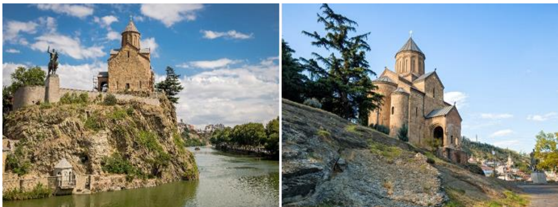
หน้าที่ 5 . ***ภาพประกอบใช้เพื่อการโฆษณาเท่านั้น***

นำท่านไปชม โบสถ์เมทเทห์คี (METEKHI CHURCH) โบสถ์ที่มีประวัติศาสตร์อยู่คู่บ้านคูเมืองของทบิลีซี ตั้งอยู่บริเวณริมหน้าผาของแม่น้ำทวารี เป็นโบสถ์หนึ่งที่ตั้งอยู่ในบริเวณที่มีประชากรอาศัยอยู่ ซึ่งเป็นประเพณีโบราณที่มีมาแต่ก่อน กษัตริย์วาคตัง ที่ 1 แห่งจอร์กาซาลี ได้สร้างป้อมและโบสถ์ไว้ที่บริเวณนี้