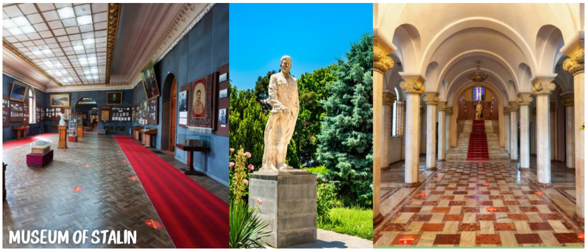
MUSEUM OF STALIN

นำท่านออกเดินทางสู่เมือง KUTAISI เป็นเมืองเล็กๆ ที่อยู่ระหว่างเมืองท่องเที่ยว UPLOSTSIKHE หรือ GORI และเมือง MESTIA (ใช้เวลาเดินทางประมาณ 2.30 ชม.)