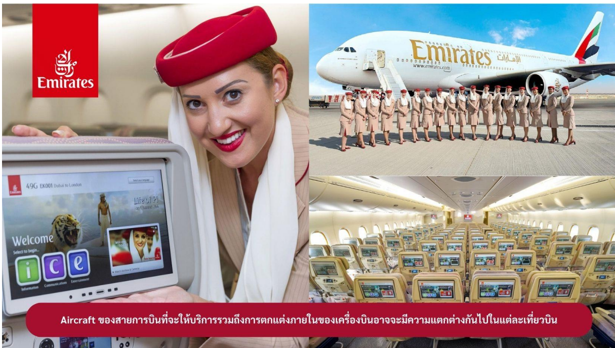
Aircraft ของสายการบินที่จะให้บริการรวมถึงการตกแต่งภายในของเครื่องบินอาจจะมีความแตกต่างกันไปในแต่ละเที่ยวบิน

22.00 น. !!!! คณะเดินทางพร้อมกัน ณ สนามบินสุวรรณภูมิ อาคารผู้โดยสารขาออกระหว่างประเทศ ชั้น 4 ประตู 9 แถว T สายการบินเอมิเรตส์ แอร์ไลน์ (EK) เจ้าหน้าที่ให้การต้อนรับและอำนวยความสะดวก