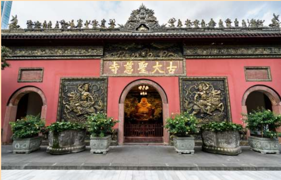
ติดกันนำท่านสู่ ถนนคนเดินไท่กู๋หลี่ (Taikoo Li) ไท่กู๋หลี่เป็นที่ตั้งของวัด ซ้อปั้งคอมเพล็กซ์ ร้านอาหาร ห้างสรรพสินค้าใต้ดิน โรงภาพยนตร์ Hermes, Gucci, Apple เป็นต้น