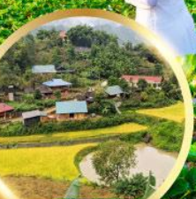
หมู่บ้านกัตกัต