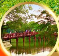
ทะเลสาบคินดาบ