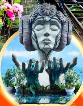
โมนาน่า ซาปา คาเฟ่