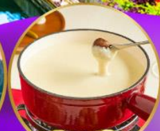
ฟองดูชีส