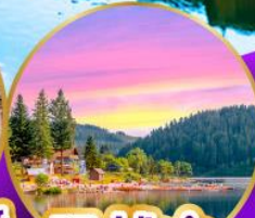
ทิกิเซ่ ปาด่า