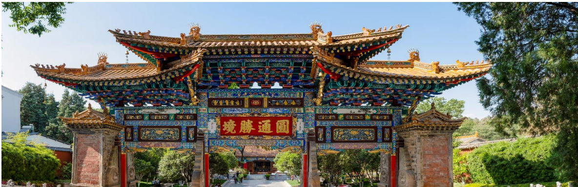
GO1CNXKMG-MU006 บินตรงเชียงใหม่ คุนหมิง ต้าหลี่ ลี้เจียง (นั่งรถไฟความเร็วสูง) 5 วัน 4 คืน (MU)

บ่าย นำคณะเข้าชม วัดหยวนทง ซึ่งเป็นวัดที่ใหญ่และเก่าแก่ของมณฑลยูนนานตั้งอยู่ที่ถนนหยวนทงเจียง เป็นอารามทางพระพุทธศาสนาที่ใหญ่ที่สุดในคุนหมิงอายุเก่าแก่กว่าพันปีภายในวัดตกแต่งร่มรื่นสวยงามกลางลานมีสระน้ำขนาดใหญ่ มีสะพานข้ามไปสู่ศาลาแปดเหลี่ยมกลางสระด้านหลังวัดเป็นอาคารสร้างใหม่ประดิษฐานพระพุทธรูปพระพุทธรูปชินราช(จำลอง)ซึ่งพลเอกเกรียงศักดิ์ ชมะนันทน์ นายกรัฐมนตรีคนที่ 15 ของไทยให้อัญเชิญไปประดิษฐานไว้ ณ ที่วัดหยวนทงแห่งนี้