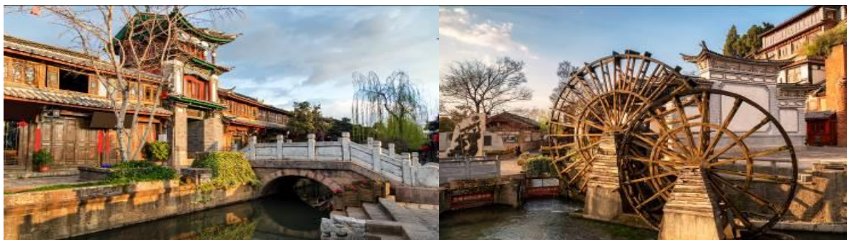
GO1CNXKMG-MU006 บินตรงเชียงใหม่ คุณหมิง ต้าหลี่ ลี่เจียง (นั่งรถไฟความเร็วสูง) 5 วัน 4 คืน (MU)

นำท่านชม เมืองโบราณลี่เจียง หรือเมืองโบราณต้าเหยียนเจิ้งซึ่งเป็นเมืองที่สร้างขึ้นมาในสมัยต้นราชวงศ์ถังมีประวัติยาวนานกว่า 1,300 ปีตัวเมืองตั้งอยู่ท่ามกลางการโอบล้อมด้วยสายน้ำน้อยใหญ่ที่ไหลมาจากสระมังกรดำพื้นที่ตั้งของเมืองโบราณแห่งนี้มีรูปร่างลักษณะคล้ายหินผมหมีกินในเขตเมืองโบราณยังคงความงามในอดีตไว้อย่างสมบูรณ์เช่นอาคารไม้แบบจีนโบราณต้นหลิวริมธารที่ยังคงพลิ้วไปตามสายลมลำธารน้ำที่ไหลผ่านเมืองแห่งนี้ด้วยความสวยงามเหล่านี้ทำให้เมืองโบราณลี่เจียงได้ถูกบันทึกเป็นมรดกทางวัฒนธรรมของโลกโดยองค์การยูเนสโกนอกจากนี้ยามค่ำคืนก็มีการประดับไฟแสงสีงดงามอีกด้วย