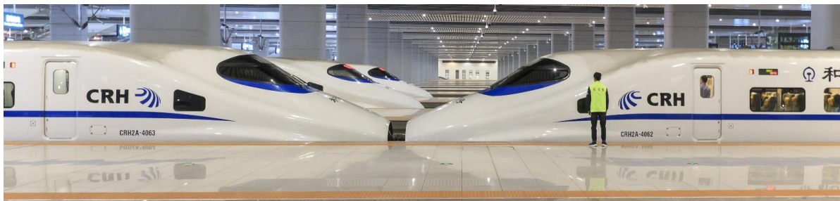
GO1CNXKMG-MU006 บินตรงเชียงใหม่ คุนหมิง ต้าหลี่ ลี้เจียง (นั่งรถไฟความเร็วสูง) 5 วัน 4 คืน (MU)