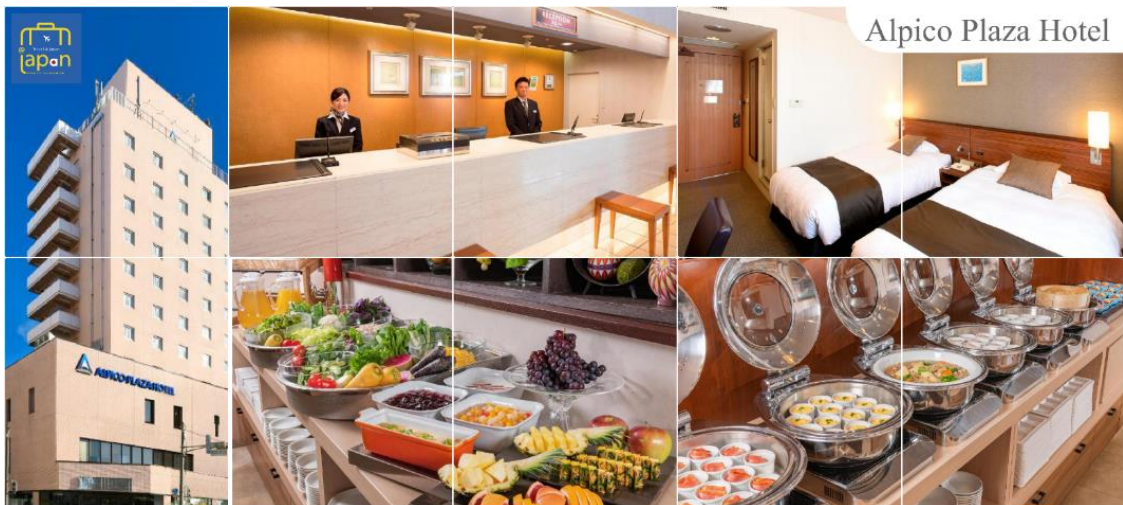
Alpicco Plaza Hotel

พักที่ ALPICO PLAZA HOTEL หรือเทียบเท่าระดับเดียวกัน