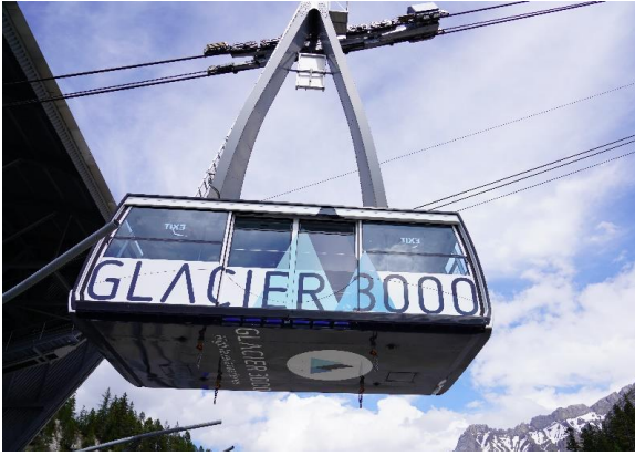
Highlight ! กระเช้าไฟฟ้ายอดนิยมที่จุผู้โดยสารได้ถึง 125 คน

นำท่านเดินทางสู่ หมู่บ้านโคล เดอ ปียง (Col De Pillon) เป็นที่ตั้งของสถานี นำท่านนั่งกระเช้าลอยฟ้า สู่ ยอดเขากลาเซียร์ 3000 (Glacier 3000) มีความสูงเกือบ 3,000 เมตรเหนือระดับน้ำทะเล ชมทิวทัศน์อันงดงามของท้องฟ้าและเทือกเขามากมายแบบพาโนรามา และให้ท่านทำกายภาพความสูงเดินบน "The Peak Walk by Tissot" สะพานแขวนที่มีความยาว 107 เมตร ข้ามหน้าผาที่ระดับความสูง 3,000 เมตร ทำให้เป็นสะพานแขวนที่สูงที่สุดในโลก