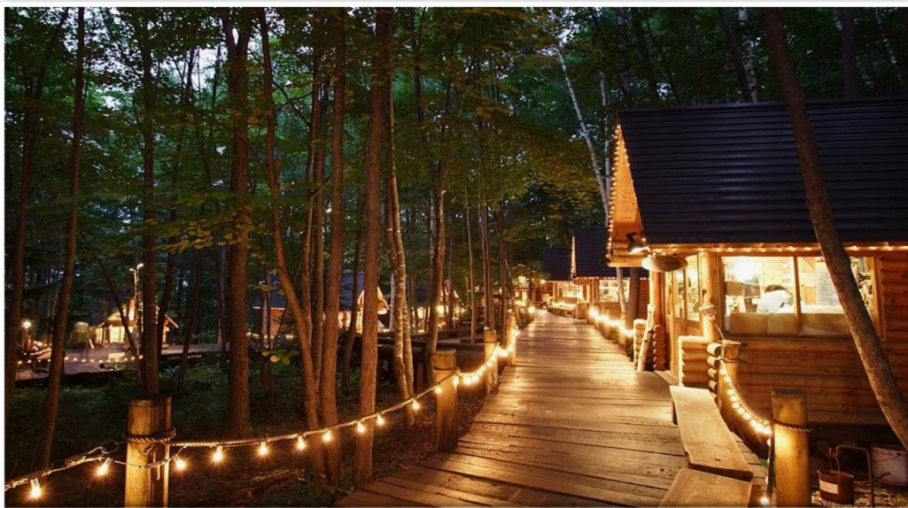
รับประทานอาหารกลางวัน ณ ภัตตาคาร

โรงงานชีสฟูราโน(FURANO CHEESE FACTORY) แหล่งผลิตชีสคุณภาพชั้นยอดอันเลื่องชื่อของเมืองฟูราโน (FURANO) มีการเปิดให้นักท่องเที่ยวเข้าชมขั้นตอนการผลิตชีสท้องถิ่นคาแมมเบิร์ก(CAMAEMBERT) ผ่านทางกระจก ที่ทำให้เห็นทุกขั้นตอนที่สำคัญยังสามารถลิ้มรสตัวอย่างชีสในร้านค้าของโรงงานได้อีกด้วย โดยชีสที่ถือเป็นไฮไลท์ที่แปลกแบบสุด ๆ ก็คือ ชีสดำ ถือว่าเป็นชีสพิเศษที่หาทานได้เท่านั้น