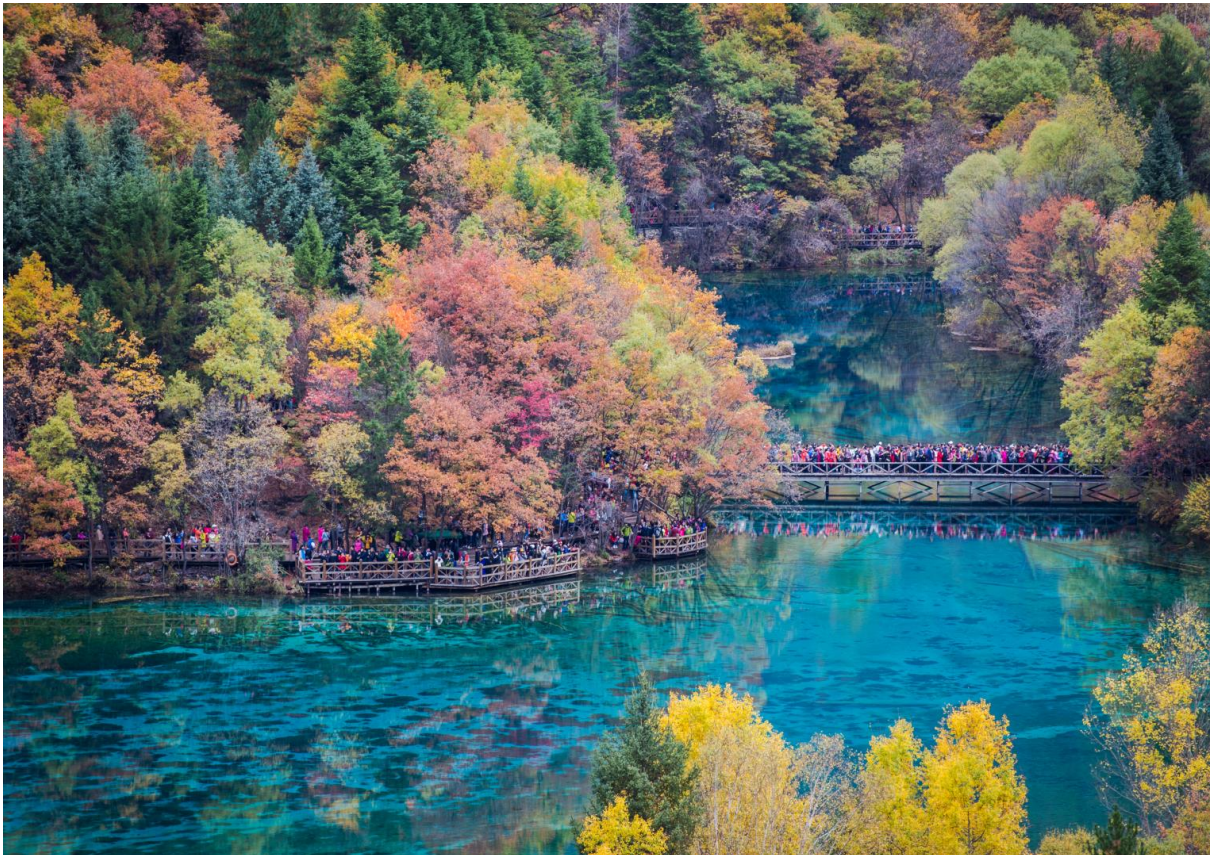
GO1TFU-SL001 เฉิงตู จิวจ้ายโกว หวงหลง ภูเขาสี่ตรุณี 6วัน 5คืน โดยสายการบิน Lion Air (SL)

นำท่านเดินทางสู่ อุทยานแห่งชาติจิวจ้ายโกว (เดินทางโดยใช้รถเวียนของอุทยาน) เพื่อชมมรดกโลก อุทยานแห่งชาติธารสวรรค์ “จิวจ้ายโกว” ครอบคลุมพื้นที่กว่า 720 ตารางกิโลเมตร และอยู่สูงกว่าระดับน้ำทะเลถึง 2,500 เมตร ชื่อของ “จิวจ้ายโกว” นั้นเป็นคำภาษาจีนที่แปลว่า “ธารน้ำเก้าหมู่บ้าน” เพราะในอดีตนั้นมีหมู่บ้านชาวทิเบตทั้งหมด 9 หมู่บ้านอยู่ริมธารน้ำเหล่านี้ และเนื่องจากชาวทิเบตนั้น มีความศรัทธาในภูเขาและสายน้ำ จึงมีความเชื่อว่าจิวจ้ายโกวนี้เป็นดินแดนแห่งขุนเขาและธารน้ำศักดิ์สิทธิ์มีแม่น้ำลำธาร มีทะเลสาบใหญ่น้อยมากมายกว่า 144 แห่ง และน้ำตกขนาดใหญ่ น้ำในทะเลสาบสีมรกตใสสะอาดและสวยงาม สะท้อนภาพของภูเขาท้องฟ้าสีคราม ป่าดงดิบอันอุดมสมบูรณ์ ทุกสถานที่ล้วนเป็นความงามที่ธรรมชาติได้บรรจงสร้างไว้ได้ตั้งภาพวาดในจินตนาการจึงได้รับการขึ้นทะเบียนให้เป็นมรดกโลกทางธรรมชาติ โดยองกรณ์ UNESCO เมื่อปี ค.ศ. 1992 และเป็นสถานที่ท่องเที่ยวระดับ 5A ของจีน ที่ใครๆ ต่างก็ใฝ่ฝันอยากไปเยือนสักครั้งในชีวิต