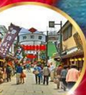
ย่านโบราณ ชิชะมาตะ