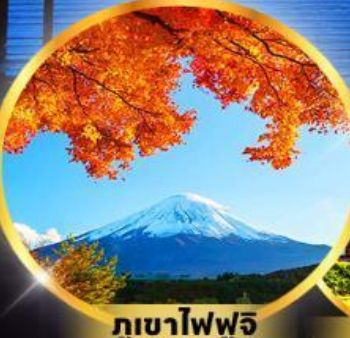
ภูเขาไฟฟูจิ