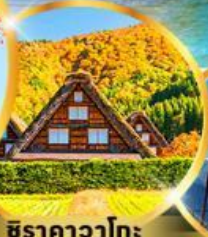
ชิราคาวาโกะ