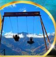
Yoo hoo! Swing