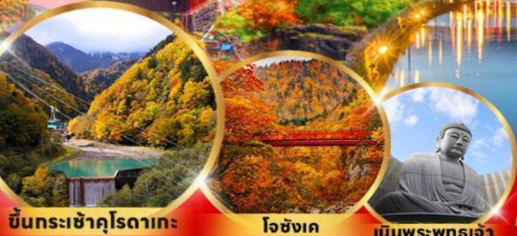
ขึ้นกระเช้าคุโรดากะ