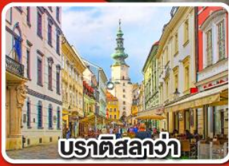
ปราตีสลลว่า

เที่ยวเมือง คาร์โลวารี เมืองแห่งสปา พร้อมเมนูพิเศษเปิดโบฮีเมีย