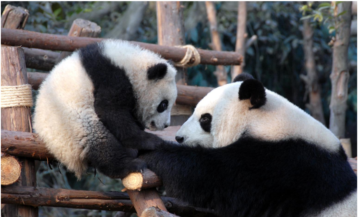
GO1TFU-FD001 เฉิงตู จิวจ้ายโกว ทวงหลง ดูหมีแพนด้า โดยสายการบิน Air Asia (FD) 6วัน 4คืน

เช้า รับประทานอาหารเช้า ณ ห้องอาหารภายในโรงแรม (มื้อที่ 10)