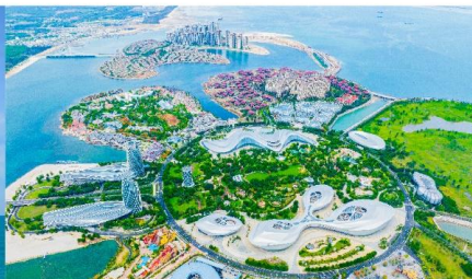
เกาะดอกไม้