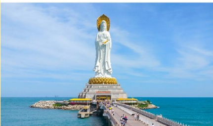
เจ้าแม่กวนอิมหนานซาน