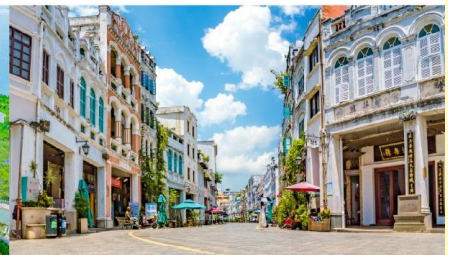
ถนนโบราณฉีหลาว

*ทางบริษัทฯ ขอสงวนสิทธิ์ในการสลับโปรแกรมทัวร์ตามความเหมาะสมขึ้นอยู่กับสถานการณ์หน้างาน โดยคำนึงถึงผลประโยชน์ของลูกค้าเป็นสำคัญ