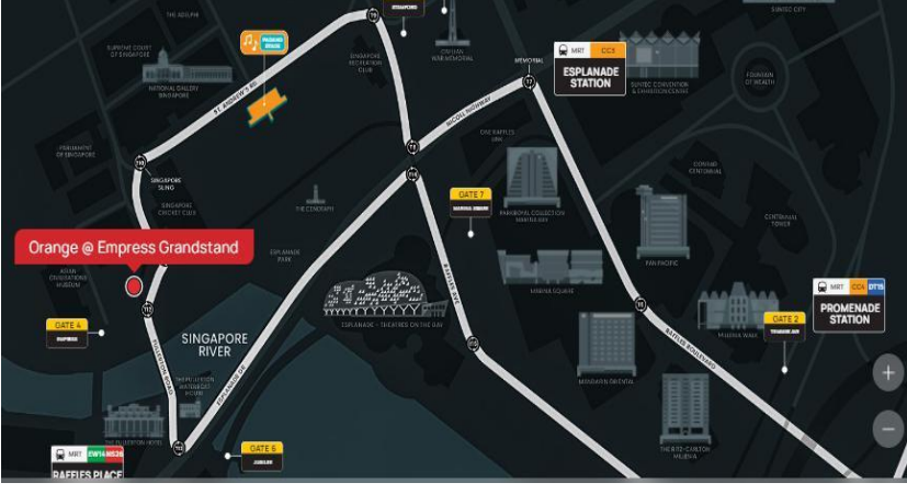
อิสระเดินทางกลับโรงแรมตามอัธยาศัย