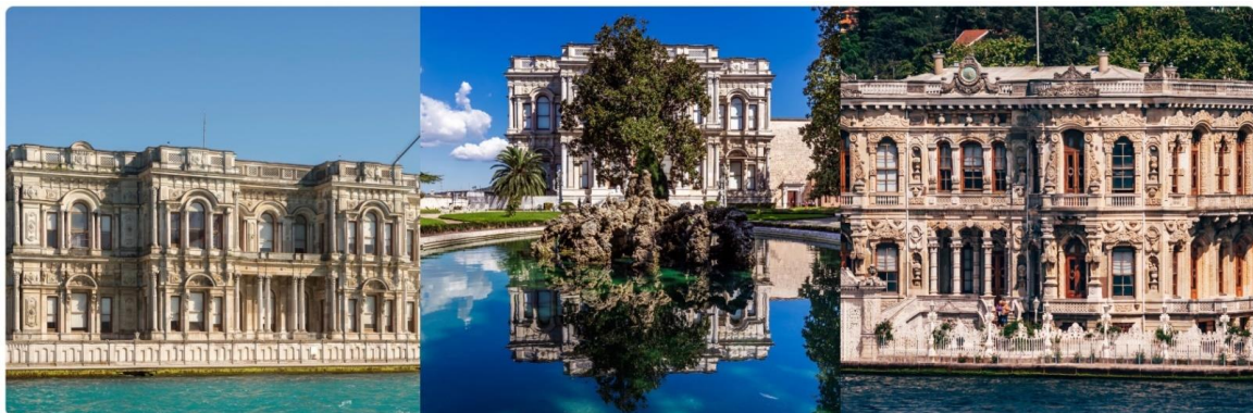
หน้า 14 (ภาพใช้เพื่อการโฆษณาเท่านั้น)

จากนั้นนำท่านชม พระราชวังเบลเลอเบย์ (BEYLERBEYI PALACE) เป็นพระราชวังที่ตั้งอยู่ริมฝั่งทะเล ของช่องแคบบอสฟอรัสในฝั่งเอเชีย ใกล้กับสะพานข้ามช่องแคบฯ แห่งแรก ถือเป็นพระราชวังฤดูร้อน