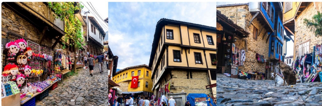
หน้า 15 (ภาพใช้เพื่อการโฆษณาเท่านั้น)

จากนั้นให้ท่านได้สัมผัสบรรยากาศใหม่ ไม่เหมือนใครกับการชมเมืองอิสตันบูล รูปแบบสไตล์เมืองเก่า นั่นคือ ย่าน FENER & BALAT ชุมชนชาวอียิปต์เก่าแก่ กว่า 100 ปี ที่อาศัยอยู่ในเขตเมืองเก่าของกรุงอิสตันบูล โดยอยู่ฝั่งบริเวณเขตยุโรป ท่านจะได้สัมผัสความคลาสสิกของตึกเก่า ที่ปลูกสร้างตามแนวสันเขาเล่นระดับแบบมีเอกลักษณ์ และที่สำคัญยังสวยงาม ด้วยสีสันสดใส สะดุดตา น่ามอง จนทำให้เกิดเป็นมุมถ่ายรูป ชิคๆ เก๋ๆ มากมายในเขตชุมชนแห่งนี้ และน่าแปลกใจเป็นอย่างมาก เนื่องจากความสงบเงียบ และ