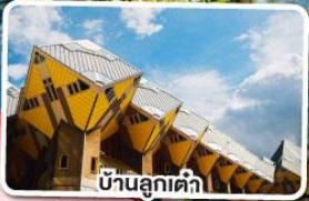
บ้านลูกค้ำ