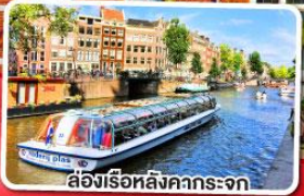
ล่องเรือหลังคคกระจก