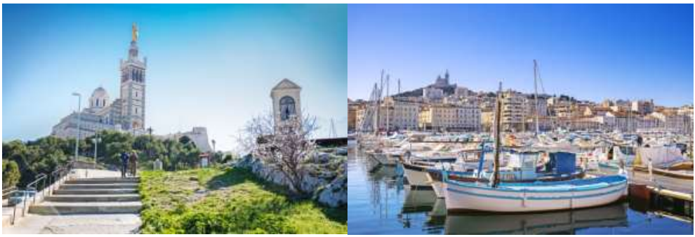
6 | รูปภาพประกอบใช้เพื่อการโฆษณาเท่านั้น

📌 รับประทานอาหารเช้า ณ ห้องอาหารของโรงแรม (มื้อ5) จากนั้นนำท่านถ่ายรูปกับมหาวิหารนอเทรอดาม เดอ ลา การ์ด (Notre-Dame de la Garde) เป็นโบสถ์ที่เป็นสัญลักษณ์ของเมือง ตั้งอยู่บนเขาซึ่งโดดเด่นเป็นสง่า สถาปัตยกรรมภายในก็เป็นเอกลักษณ์ โดยมียอดเป็นรูปปั้นพระแม่มาเรียสีทอง ยืนอุ้มพระบุตรไว้ในอ้อมแขน “La Bonne Mère” ซึ่งเชื่อว่า พระแม่คอยดูแลและลบล้างภัยอันตรายแก่ชาวเมืองและคนทั้งเมือง จากนั้นชมสวน The Palais Longchamp สวนแห่งนี้จึงถูกสร้างขึ้นเพื่อการเฉลิมฉลองที่ไม่ต้องขาดน้ำในการอุปโภคบริโภคอีกต่อไป เป็นสวนสวยใจกลางเมือง ภายในตัวอาคารจะมีรูปปั้นที่แสดงถึงความอุดมสมบูรณ์ เช่น รวงข้าว และพวงองุ่น และมีน้ำพุใจกลางสวน ที่แสดงถึงความชุ่มชื้นและอุดมด้วยน้ำท่านั่นเอง ชมมหาวิหารมาร์เซย์ (Marseille Cathedral) วิหารแห่งนี้ มีความเป็นเอกลักษณ์ ถูกสร้างขึ้นในช่วงศตวรรษที่ 19 ตัวอาคารมีลักษณะเป็นสถาปัตยกรรมแบบ Byzantine ที่โดดเด่น ภายในมีการตกแต่งด้วยรูปปั้นที่สวยงาม บนเพดานจะแขวนเรือลำเล็กๆไว้หลายลำ เพื่ออวยพรนักเดินเรือที่ผ่านไปมาที่ท่าเรือแห่งนี้ จากนั้นอิสระเดินเล่นบริเวณท่าเรือเก่า (The Old Port) ที่ในตอนเช้าจะมีตลาดนัดปลา โดยชาวประมงจะนำปลาและอาหารทะเลมาวางขาย นอกจากนั้นจุดนี้ยังเป็นจุดหลักที่นักท่องเที่ยวต้องมาแวะเยี่ยมชม เพราะเป็นท่าเรือที่มีความสวยงามเรือถูกจอดเรียงราย โดยมีโบสถ์ Notre-Dame de la Garde เป็นฉากหลังสวยงาม ซึ่งเมื่อเดินออกไปจากท่าเรืออีกนิดหน่อย จะเจอ shopping street มีห้างร้าน ทั้งเสื้อผ้าแฟชั่น กระเป๋า รองเท้า แบรินด์ดีดั่งและแบรินด์ท้องถิ่นมากมาย