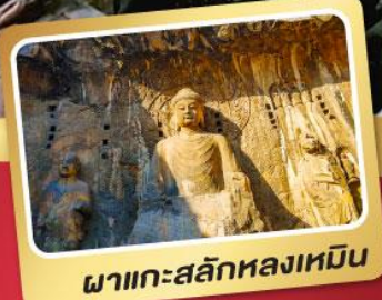
ผาแกะสลักหลงเหมิน