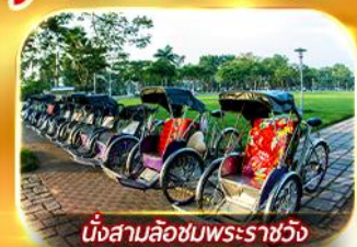
นั่งสามล้อชมพระราชวัง

สัมผัสความสวยงามหมู่บ้านสไตล์ฝรั่งเศสที่บานาฮิลล์ วัดเทียนมู่ พระราชวังเว้ สัมผัสเมืองโบราณฮอยอัน ล่องเรือกระดัง