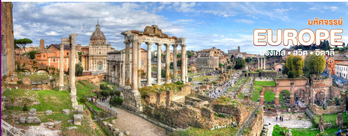
มหัศจรรย์ EUROPE ฝรั่งเศส • สวิต • อิตาลี

มหัศจรรย์ของโลกยุคกลาง ต้นแบบของสนามกีฬาของโลก เป็นแหล่งบันเทิงที่ใหญ่ที่สุดในโรมัน สร้างขึ้นในสมัยของจักรพรรดิเวสเปาเซียนในปี ค.ศ. 70 ก่อนเปิดอย่างเป็นทางการในอีก 10 ปีต่อมาในสมัยพระเจ้าไททัส เป็นสนามกีฬาที่จะเป็นการประชันการต่อสู้ระหว่างเหล่านักรบกลาดิเอเตอร์ด้วยกันเอง และกับสัตว์ดุร้าย เช่น สิงโต ช้าง แรด เป็นต้น โดยบ้างก็กล่าวกันว่า การต่อสู้ในโคลอสเซียมทำให้สัตว์บางชนิดแทบจะสูญพันธุ์เลยทีเดียว การสร้างอาคารแบบอิมพีเรียลกลม 3 ชั้นขนาดใหญ่แห่งนี้ยังถือว่าการผลิตซีเมนต์แห่งแรกของโลกอีกด้วย บริเวณใกล้เคียงกันท่านสามารถเดินถ่ายรูปด้านหน้ากับ โรมันฟอรัม (ROMAN'S FORUM) อดีตศูนย์กลางทางสังคม เศรษฐกิจ และวัฒนธรรมของอาณาจักรโรมัน โดยบริเวณนี้นั้นเป็นที่ตั้งของประตูชัย 2 แห่ง ที่เป็นต้นแบบของฝรั่งเศส นั่นคือ ประตูชัยคอนสแตนติน สร้างขึ้นในครั้งที่พระเจ้าคอนสแตนตินได้ชัยชนะเหนือพระเจ้าแมกเซนเทียส และประตูชัยไททัสที่สร้างขึ้นหลังจากได้รับชัยชนะเหนือเมืองเยรูซาเล็มในปี ค.ศ. 81