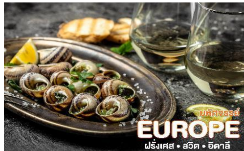
มหัศจรรย์ EUROPE ฝรั่งเศส • สวิต • อิตาลี

จากนั้นนำท่านแวะถ่ายรูปด้านหน้า พิพิธภัณฑน์ลูฟวร์ (LOUVRE MUSEUM) เป็นสถานที่จัดแสดงและเก็บรักษาผลงานทางศิลปะที่ทรงคุณค่า