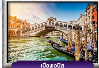
เมืองเวนิส

พิเศษ! หอยเอสคาโก้ สวิสชีสฟองดู สปาเก็ตตี้เส้นหมึกคาวอนิส