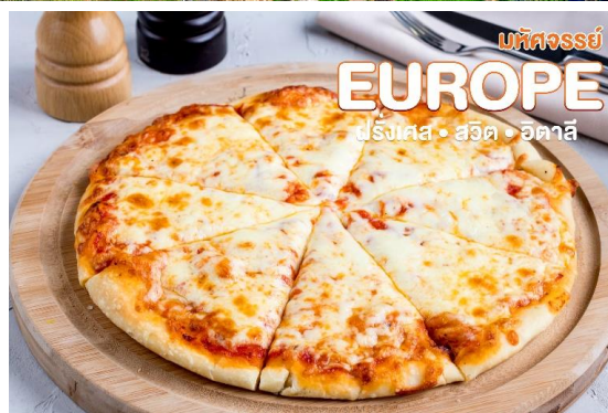
มหัศจรรย์ EUROPE ฝรั่งเศส • สวิต • อิตาลี

นำท่านชมความงามของ น้ำพุเทรวี (TREVI FOUNTAIN) ที่มีกล่าวกันว่าเป็นน้ำพุที่สวยงามที่สุดแห่งหนึ่งในโลก นำท่านเดินชมและถ่ายรูปบริเวณ บันไดสเปน (SPANISH STEPS) บันไดที่กว้างที่สุดในยุโรป เชื่อมระหว่างจัตุรัสสปีงนา กับโบสถ์ทรีนิตี นอกจากนี้ยังมีสินค้าแบรนด์เนมหลากหลายให้ท่านได้เลือกสรรอย่างเต็มที่ ไม่ว่าจะเป็น Gucci, Louis Vuitton, Prada, Longchamp, Chanel, DIOR, Balenciaga เป็นต้น แต่หากสนใจชิมกาแฟเอสเปรสโซ่ต้นตำหรับก็มีร้านกาแฟมากมายให้ท่านได้ลิ้มลอง