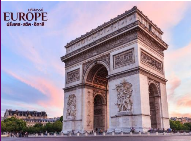
มหัศจรรย์ EUROPE ฝรั่งเศส • สวิต • อิตาลี

จากนั้นนำท่านถ่ายรูปกับ ประตูชัยอาร์กเดอเทรียงฟ์ (ARC DE TRIOMPHE) วงเวียนที่เชื่อมถนน 12 เส้นของปารีสไว้ โดยสร้างขึ้นเพื่อเป็นสคูติหารฝรั่งเศสที่ร่วมรบในสงครามต่างๆ ประตูชัยแห่งนี้ก็ยิ่งเป็นที่ฝังศพทหารนรนามในสมัยสงครามโลกครั้งที่ 1 อีกด้วย อาร์กเดอเทรียงฟ์ มีความสูง 49.5 เมตร กว้าง 45 เมตร และหนาถึง 22 เมตร ทางทิศตะวันตกยังเป็นที่ตั้งของถนนสายที่โด่งดังที่สุดของโลกสายหนึ่ง นั่นคือ ถนนช็องเซลีเซ (CHAMPS-ÉLYSÉES) ถนนที่ได้ชื่อมาจากสวนสวรรค์ของเหล่าเทพปกรณัมกรีก ในอดีตเคยเป็นส่วนหนึ่งของการขยายพื้นที่สวยหย่อมของพระราชวังค็อยเลอรี โดยเมื่อครั้งพระบาทสมเด็จพระจุลจอมเกล้าเจ้าอยู่หัวเสด็จประพาสยุโรป ทรงมีพระราชดำรัสให้นำรูปแบบถนนช็องเซลีเซมาสร้างเป็นถนนพระราชดำเนินกลางในกรุงเทพมหานคร ว่ากันว่าอัตราค่าเช่าพื้นที่บนถนนแห่งนี้มีมูลค่าสูงที่สุดในยุโรป และเป็นที่ตั้งของสินค้าแบรนด์ระดับโลกมากมาย