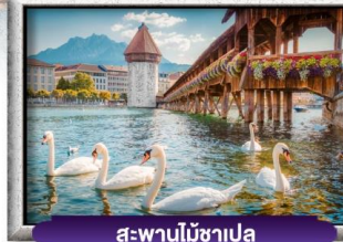
สะพานไม้ซาเปลา