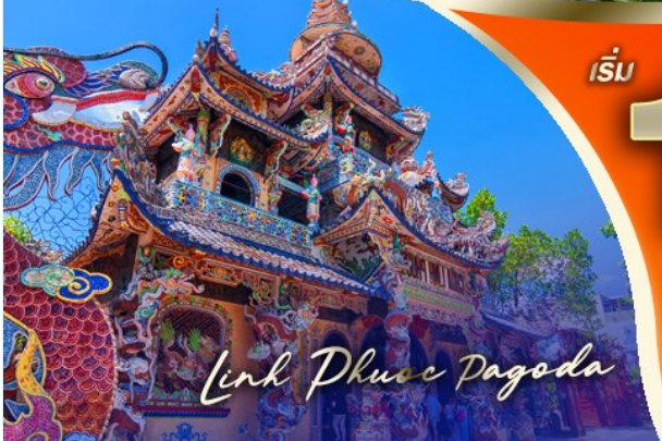
Link Phuoc Pagoda