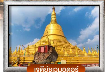
เจดีย์ชเวมอดอร์

เมนู สุดพิเศษ | กุ้งแม่น้ำเผาทำนละ 1 ตัว