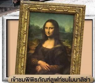
เข้าชมพิพิธภัณฑ์ลูฟวร์ชมโมนาลิซ่า