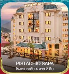
PISTACHIO SAPA โรงแรมระดับ 4 ดาว 2 คืน