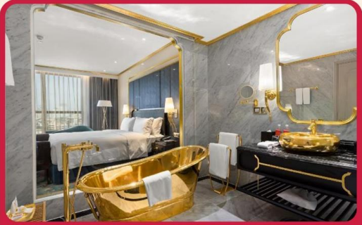
พัก Golden Lake 5 ดาว 1 คืน