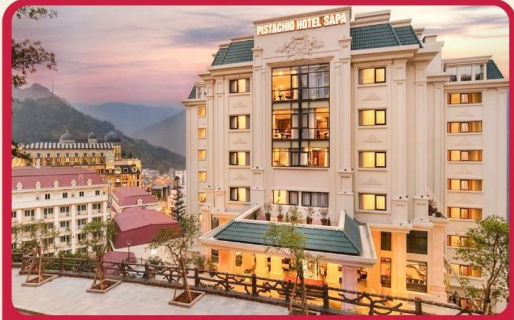
พัก Pistachio Sapa 4 ดาว 2 คืน