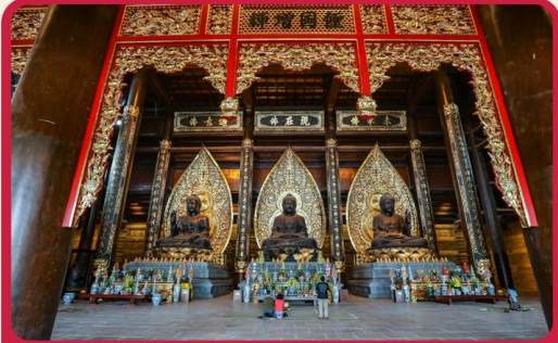
จุดเช็คอินแห่งใหม่ “วัดตามจึก”