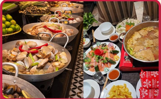
พิเศษ !!! บุฟเฟ่ต์นานาชาติ SEN BUFFET และ เมนูชาบูหม้อไฟปลาแซลมอน+ไวน์แดงดालัด