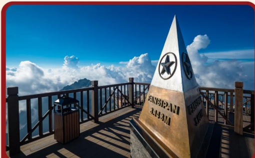
นั่งกระเช้าสู่ยอดเขาฟานซีปัน

พิเศษ !!! SEAFOOD บนเรือสโตร์เวียดนาม + ซาบูหม้อไฟปลาแซลมอน+ไวน์แดงดาด