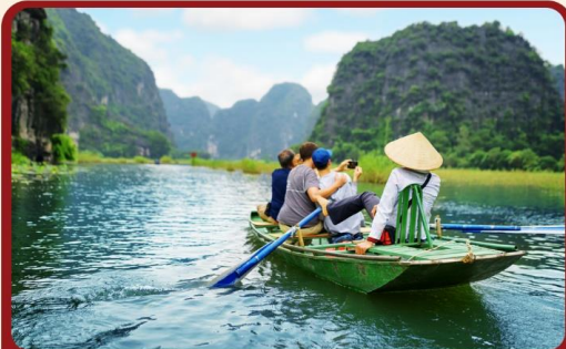
ล่องเรือตามกัก ชมวิวกุ้ยหลินแห่งเวียดนาม