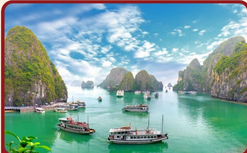
ล่องเรืออ่าวฮาลองเบย์ มรดกโลก UNESCO