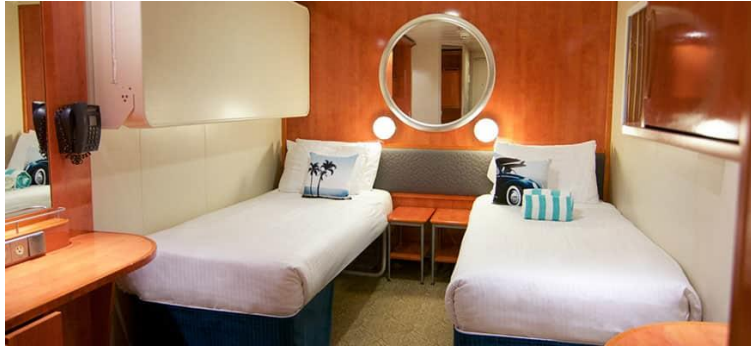
Size: 132-134 sq. ft. DECKS 4,7,8,9,10,11,13