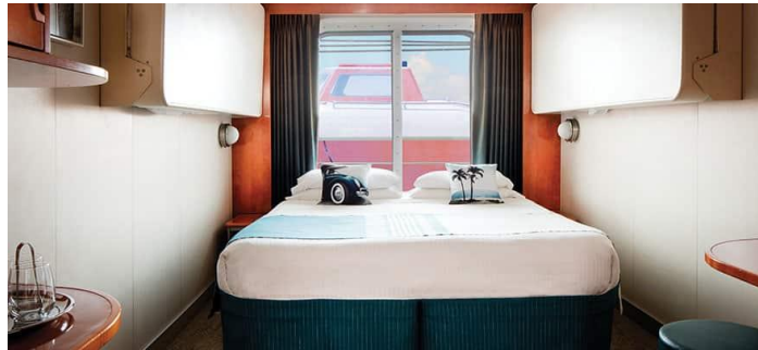
Size: 144 sq. ft. DECKS 4,7