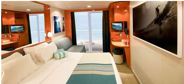
Size: 178 sq. ft. DECKS 10,11,9,8,7