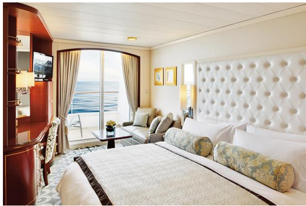
DELUXE STATEROOM WITH VERANDAH (B1) 267 sf Deck 8