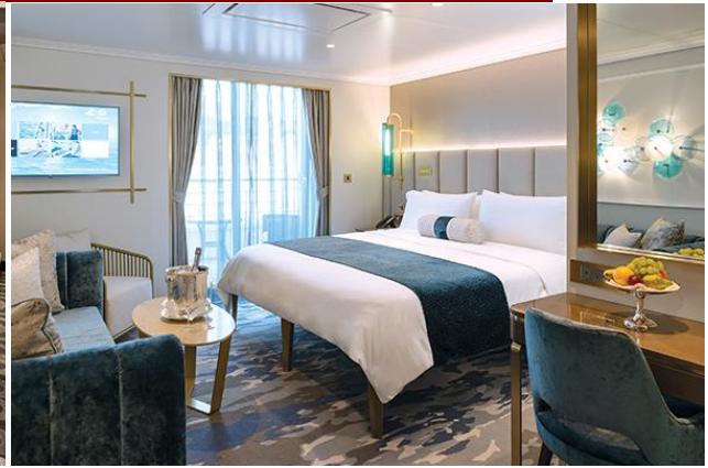
PENTHOUSE WITH VERANDAH (PH)